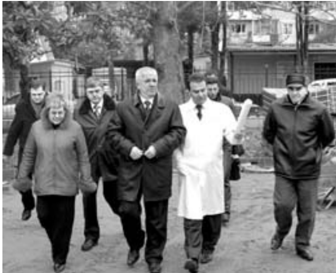
«НС» на объекте