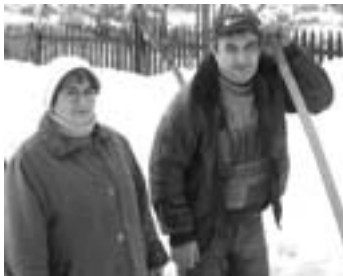
Сельские учителя – подвижники.

Обильные снегопады не могли не сказаться на жизни Раздольского сельского округа