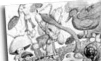
Герои нашего города

концерт стипендиатов – лауреатов краевых, всероссийских и международных конкурсов и фестивалей исполнительского мастерства и художественного творчества. Сочи на торжественном приеме представит делегация, состоящая из педагогов и учеников Сочинского училища искусств, музыкальной школы №1, школы искусств №3 и художественной школы №1.