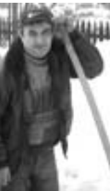
Сельские учителя – подвижники.