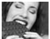
В черном шоколаде содержится повышенное по сравнению с другими какаопродуктами количество анти-