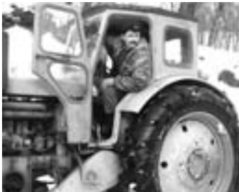
Сельские учителя – подвижники.