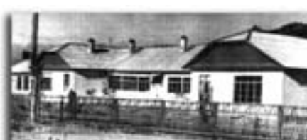
Даты в истории города

Неказистое строение барачного типа с большими окнами — таким на черно-белых снимках запечатлено первое