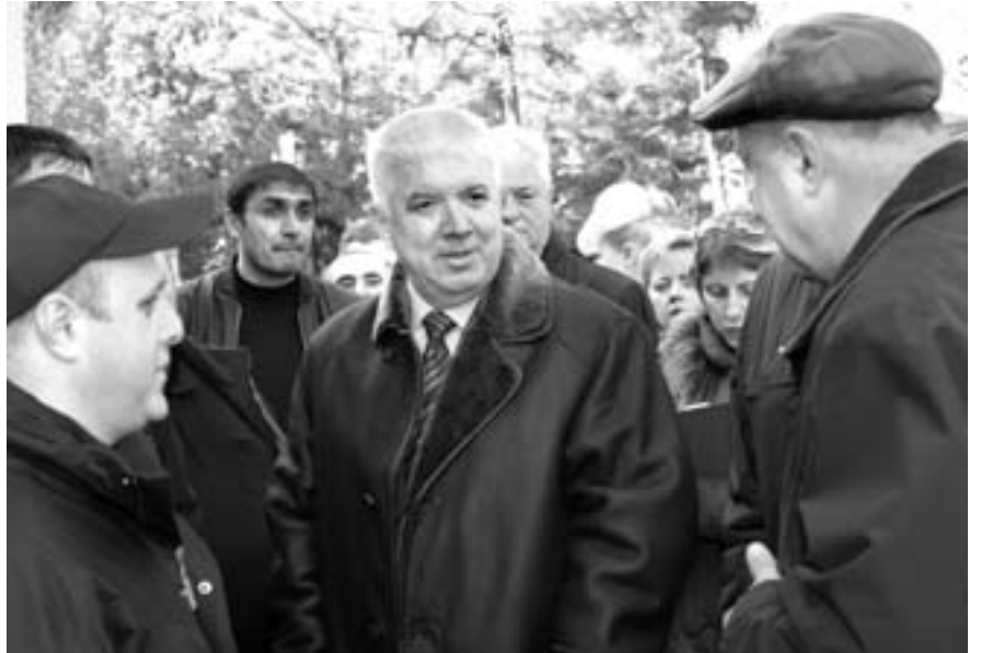
Подготовка к лету