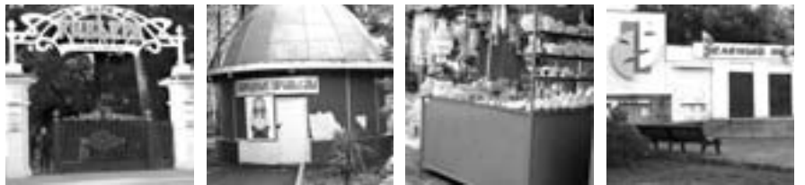
Власть и бизнес