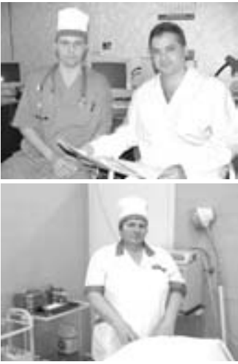
Ковалев. — Тем более что он нетиповой, а его делали специально под нашу больницу. Мы совместно со специалистами управления

— Проект, разработанный институтом „Южпроекткомму-