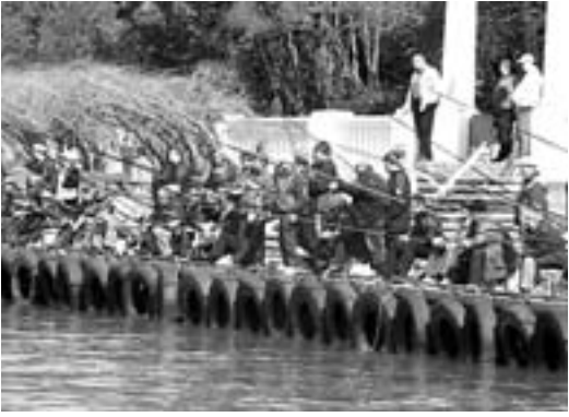
Сезон "охоты" на ставриду в Сочинском морском порту можно считать открытым.

Станислав Говорухин также является автором целого ряда художественных и документально-публицистических фильмов, получивших широкую известность.