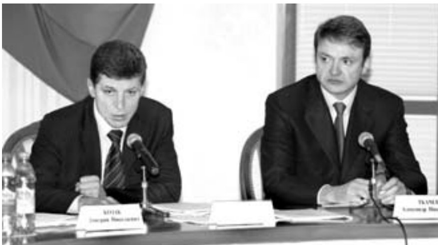
Власть и мы

До сентября предприятия санаторно-курортного комплекса города должны прийти к консенсусу по стандартам, принятым в Российской Федерации. Сделать это могут лишь те организации, которые максимально прозрачно ведут свой бизнес. Следовательно, главная доля «неделок» не сможет классифицировать свой номерной фонд.