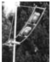
первого мая на улице Виноградной будет новый свет. В это же время старые торшеры будут демонтированы.

Вчера рабочие приступили к монтажу новых торшеров уличного освещения на улице Виноградной. Работы начались с двух сторон сразу – у северной стороны парка "Ривьера" и у поворота к пансионату "Нева". Похожи новые светильники не то на парус, не то на крыло чайки, но удивительно удачно вписываются в городскую среду. Как пояснил представитель группы компаний "Светосервис" в Сочи Сергей Якушев, монтаж новых светильников закончится за две недели, и уже