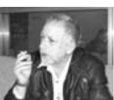
В кадр любой ценой. Если говорить обо мне, то мое появление в "телевинооре" зависит от слухов и необходимости. Телевидение – это сублимация нерализованного творческого потенциала, возможность творить, возможность делать то, что быстро превращается в результат. Это болезнь, без этого я себя уже не мыслю. Но это не возникает на пустом месте. Я с 12 лет серьезно занимаюсь фотографией, в 14 снимал любительские фильмы на 8-миллиметровую кинокамеру и сам монтировал их на монтажном столе...

Линю у меня симпатично всегда вызывает те, для кого главное не выйти в кадр, а ответить на вопрос: "Зачем я это делаю?" К сожалению, таких людей на порядок меньше, чем желающих быть